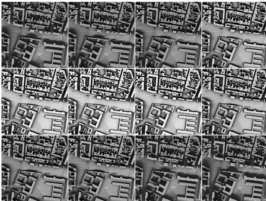
Figura 1 - Radiazione solare globale per un'area nei dodici mesi dell'anno

L'elaborazione ha prodotto dodici raster, ognuno dei quali rappresenta la radiazione solare mensile. Per collegare queste informazioni ad ogni fabbricato della CTC si è eseguita una sequenza di operazioni limitate esclusivamente all'interno delle geometrie degli edifici, in modo da abbreviare i tempi di calcolo.