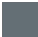
GRIGIO SCURO FERROMICACEO RAL 7011