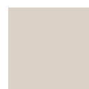
GRIGIO AVORIO RAL 1013