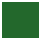
VERDE SCURO RAL 6005