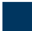
BLU TRAFFICO RAL 5017