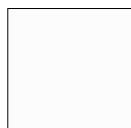
BIANCO RAL 9010