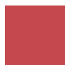
ROSSO SCURO RAL 3001